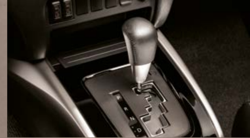
5 İLERİ OTOMATİK ŞANZİMAN